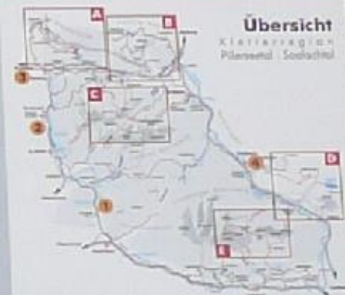
Übersicht KLETTERREGION Pillerseetal / Seefeldtal

Länge: 10m Höhe: ca. 12m Verankerungspunkte fix, gespannt muss die Highline natürlich selbst werden.