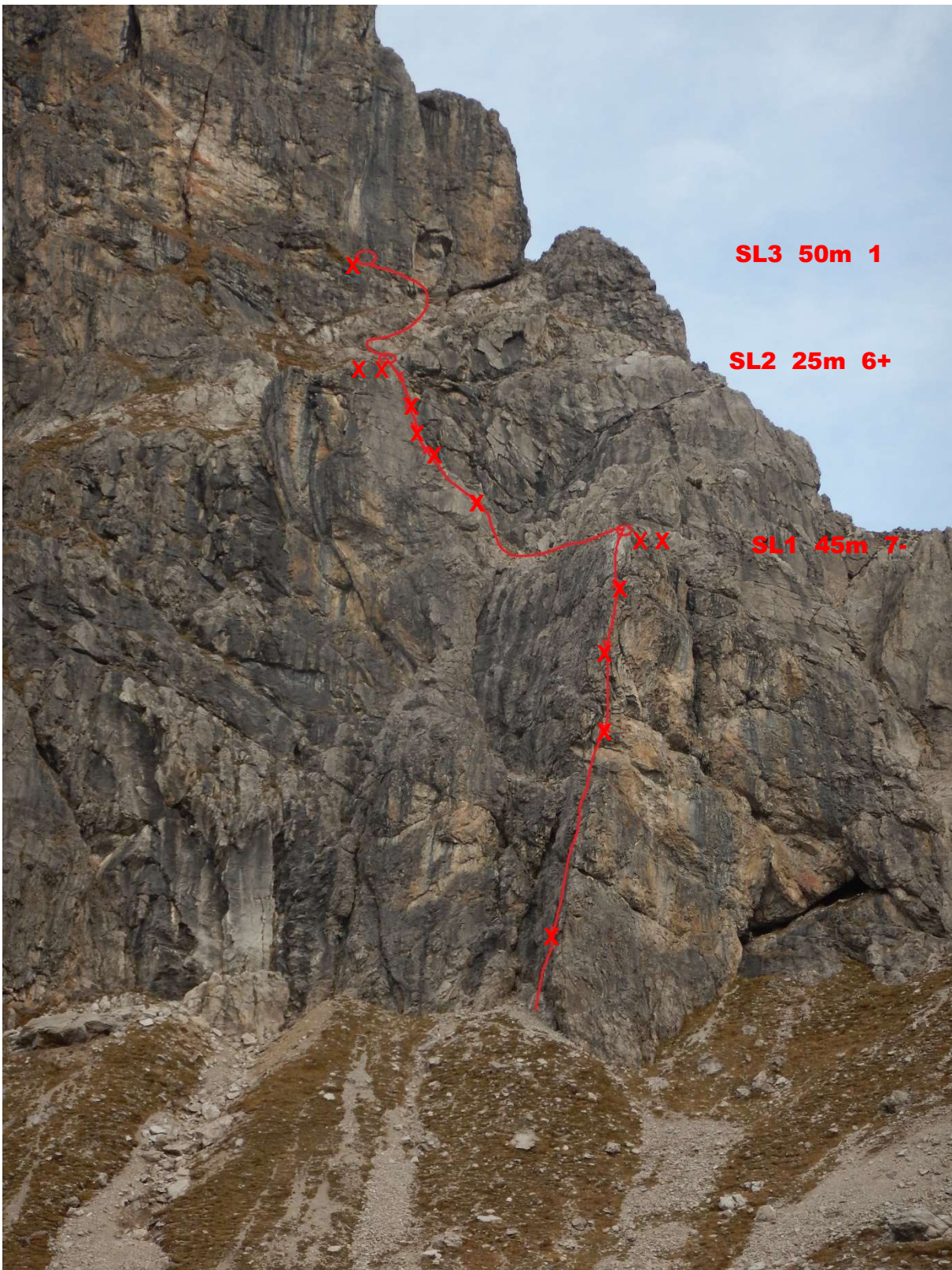
Unterer Wandteil, SL 1 bis 3