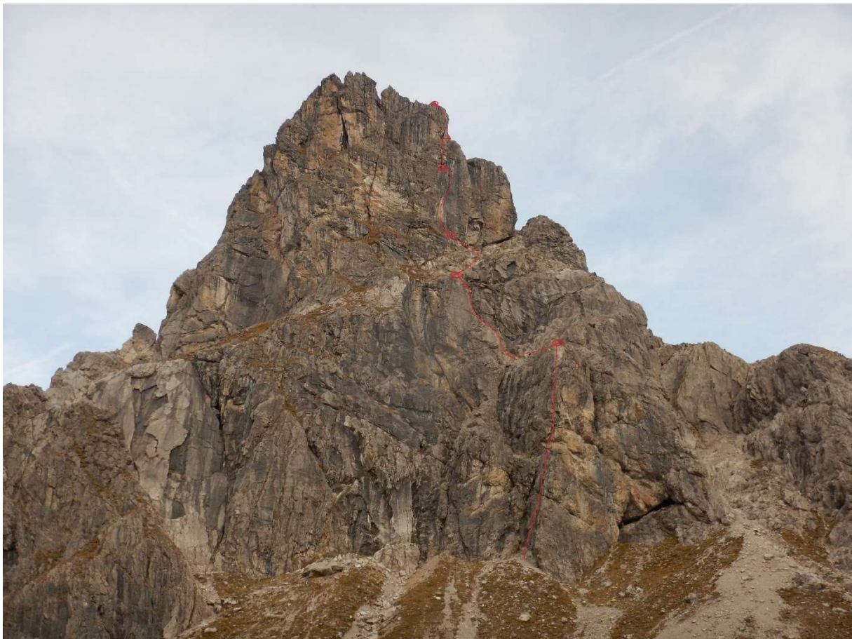
Balschturm Südostwand Übersichtsbild

Vom Gipfel nach Norden in die Scharte zur Baltschespitze, aus dieser durch eine Rinne nach rechts (Ost) absteigen.